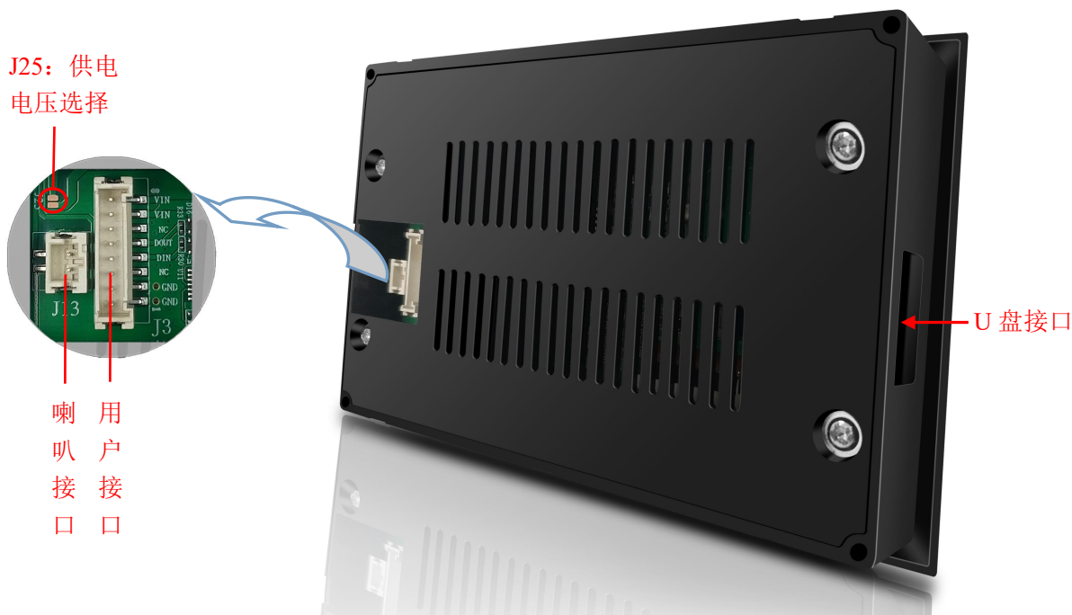
图 1 产品外观及硬件配置图