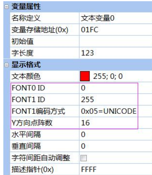
图 2 文本变量属性设置

FONT0 字库用于显示字符串的字母和数据，必须使用 ASCII 编码，不需要选择编码方式。