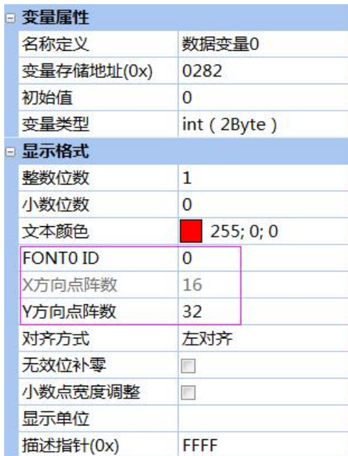
图 1 数据变量属性设置

必须正确设置字库相关属性，字库文件 FONT0 ID、Y 方向点阵数必须相互匹配，如图 1 所示，否则会导致字符不能正常显示。